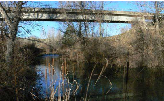
Fotografía de la estación